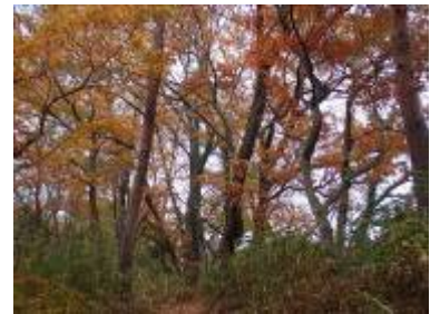
断片的に残る自然林

11月27日(日)に総会に先立って高子二十境 里山陽だまり観察会を実施しました。参加者は9名でした。高子二十境とは、今から200年前の江戸時代に高子の里に居を構えていた篤農家で儒学者でもあった熊阪覇陵に由来する散策路です。熊阪覇陵は中国の王維が著した「輞川二十境」に模して高子沼東方の丘陵に広がる景勝地20か所を選抜、名前を付し、それに合わせた漢詩(五言絶句)を読みました。そしてその子で同じく儒学者であった台州が父を顕彰するために「永慕編」として天明8年(1788)に出版しました。「永慕編」には「日本名山会図」で著名な絵師・谷文晁が描いた二十境の図と熊阪氏三代の60首の漢詩が掲載されています。