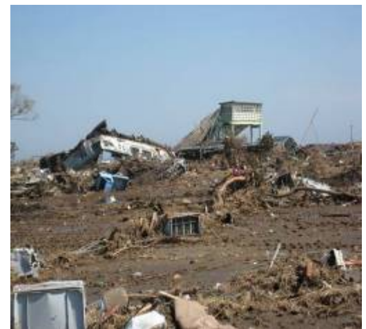
震災直後の新地駅