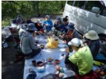
今年もおいしい芋煮ができました

賑やかにおしゃべりしながら霧の平に到着。広々とした台地は明るい陽ざしと尾根を通り抜ける風がとても心地よく展望も素晴らしい。駐車場まで戻り、第二ステージ芋煮会の始まりです。お鍋は2種類、福島風は豚肉・味噌味、山形風は牛肉・しょうゆ味、どちらも美味しく頂きました。(野菜などの下準備からたくさんのおいしいお料理まで持ってきて下さり、会の皆様に感謝です。)