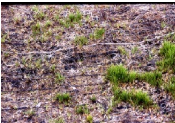
2002年8月高密度区 一部成長しているが元気なし

左の写真は、播種翌年(2001年)の夏の様子です。赤線で3つに仕切られていますが、高密度区(写真左側)には約1万粒/m 2 、中密度区(同右側)には約5千粒/m 2 、低密度区(同右上)には約3千粒/m 2 の種子(厳密には果実)を播き、春から夏にかけて成長し、緑が少しわかるようになった状態です。播種密度の高かったところでは緑が濃く見えています。ところがさらに1年、2年と経過すると、次の写真のようになりました。