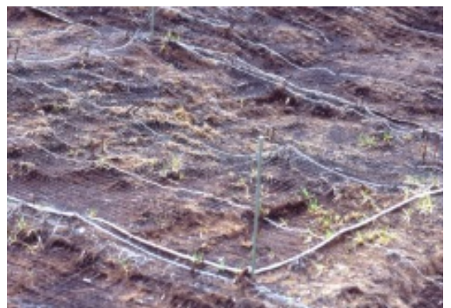
2004年7月高密度区 生残株少数で、ほぼ壊滅