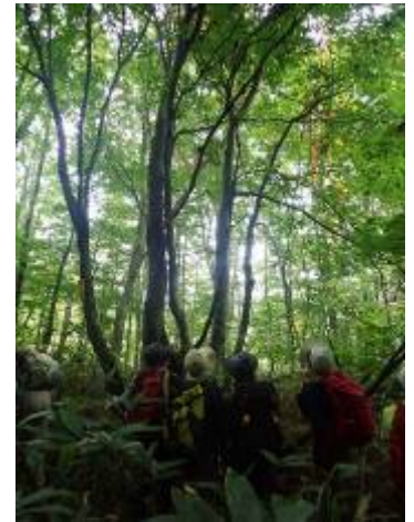
同年代のブナ林で何を見つけたのかな

植物観察の方はあまり知識がなく名前の記載が出来ませんでしたが、楽しい仲間と美味しい食事、そして自然豊かな森の秋を堪能した一日でした。皆様ありがとうございました。