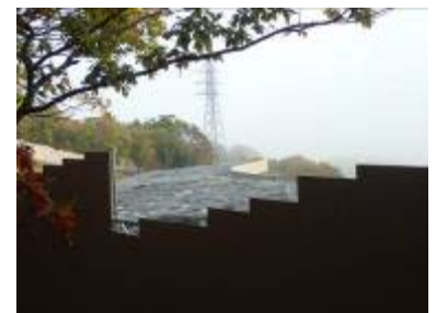
除染廃棄物仮置き場

高子沼を起点として走馬嶺、愚公谷から玉兔巖に続く里山を経て、白雲洞を訪ね、不羈坳・高子坡に戻る周回コースを辿りました。一帯は県内有数の果樹生産地であり、特に黒色ブドウ「ピオーネ」は日本でも最高級の品質と価格を誇ります。丘陵地には自然林の中にブドウやカキ畑、その麓にはモモ園が広がっていました。そんな中、断片的に残るコナラ林には阿武隈山系の代表的な針葉樹ネズが混生し、オオバヤシャブシやセンダンの大木、子守地藏、炭焼き穴など古くからの人の営みの痕跡も散見されました。しかし、その一角には除染廃棄物の仮置き場も設置されており里山の自然が福島原発事故で二重に破壊されている現実を目の当たりにしました。