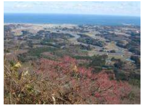
東側・太平洋、手前はマユミの実

今日、鹿狼山を一人で歩いたご褒美は、アオゲラに出会えたことだ。コゲラはよく見かけるが、鹿狼山でアオゲラに出会ったのは初めてだった。人の少ない午後に一人で歩いたのが良かった。アオゲラは暗緑色だからそれとすぐに分かった。頭と顔に赤い線があったから雄である。お腹にはコゲラと同じような黒い縞模様があった。なかなかファッションブルな鳥である。杉の木に縦に止まって何やら忙しくつついていた。後で調べたら、アオゲラは主にアリ類を餌とし、多くは虫におかされた木をつつくらしい。健全な木をつつき回すことはなく、林業では益鳥、となっていた。虫が沢山いたのか、結構長い時間、同じ所に留まってくれた。冬になると、色々な種類の小鳥たちにも会えるが、大人数でがやがやしては見る事が出来ない。一人歩きもラッキーなことが多いのだ。(2014/12/17 記)