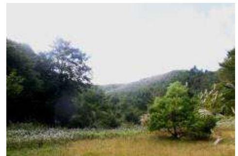
ブナのマザーツリーと植栽樹

今回の観察会では、マザーツリー近辺の生育良好なミズナラ、コナラ、クマシデ併せて5樹の樹高、樹幅、幹周(高さ70、130cm)を測定しました。ナラ類は、樹高3～5mまで達し、結実も確認されました。クマシデはナラ類より更に生育が良好でした。対照的にイタヤカエデは極めて生育が不良でした。ブナは、活着したもののナラ類よりは生育が劣っていました。ミズナラに隣接したマザーツリーの芽生えと思われるブナは比較的良好な生育をしていたことが注目されました。今回の調査から上記選定理由の3項目の内①、③は目的通り経過していますが、②のイタヤカエデについては見込み違いでした。また、クマシデは山形県での自生地は極めて少ないことが植林後、判明しました。今後の生育経過を注視していきたいと考えています。なお、植林地ではブナ林では見かけることの少ないイノシシの砂浴び跡が広範囲で観察されました。攪乱により植生が変化するのでしょうか。