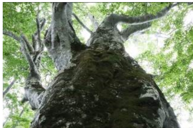
十部一峠（左）と樽石山（右）のブナ。ブナは下から見上げることが圧倒的に多いが、表情は千本差万別