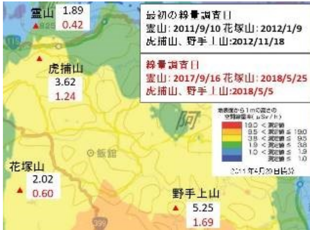
測定地点の平均値の比較

花塚山、虎捕山、野手上山の放射線量は最初の測定値のそれぞれ 30.0%、34.1%、32.2%まで減少しました。これは放射性セシウムが拡散しないと仮定した理論値より 5.1%、7.8%、11.6%多い減少でした。