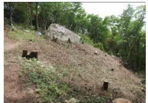
この伐採整備は必要でしょうか

5月25日の花塚山の放射線量調査の際に、頂上直下で伐採作業をしている現場に遭遇した。付近には「富士見台」の案内板と「保安林内作業許可済標識」が設置されていた。標識には、「行為の目的:歩道開設・維持管理」「行為面積:0.0209ha」と記載されていた。作業している方の話では、花塚山頂から富士山が撮影されたことを契機とした事業とのことであった。写真で分かるように伐採地は山頂直下の急傾斜地であり、斜面上に登山道を切れば豪雨に伴う表土流亡のリスクが増すことは明らかである。花塚山の落葉広葉樹林の美しい緑の回廊を楽しむハイカーは多い。水源涵養保安林を伐採して作られた眺望にいかほどの付加価値があるのだろうか。しかも富士山が見える時期は限られるのである。県内には眺望確保のため山頂周辺を伐採したり、構造物や知事の登頂記念石碑を建てたりした山が散見される。これらは、古来より山頂に鎮座する祠とは別の動機によるものであり、その行為は樹木を障害物としてしか見ない「樹も森も見ない」前近代的な行政姿勢を感じさせる。郷土の森を伐採し、美しい福島の復興と誇れるのだろうか。