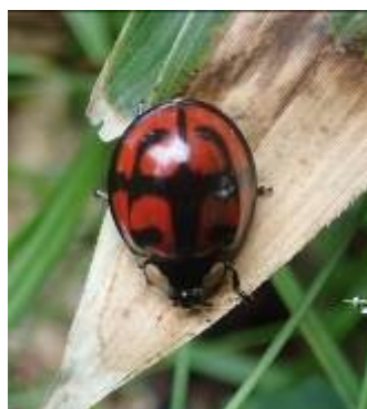
カメノコテントウ

ミズナラに寄生する。ミドリカミキリやアオカミキリ、アオムシダマシに似ている。体色が雌はオレンジ、雄は淡青色であった。アオムシダマシの触角と脚はうすい黄褐色。