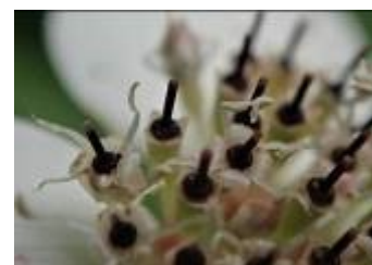
ゼラチンの様なゴゼンタチバナの花弁