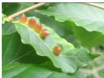
ブナハマルタマフシ

観察会とは、離れますが。毎朝の散歩コースの胡桃川にカモの親子を発見。とても可愛い。今日も、会えるかな。涼しそうに川の流れに乗って泳いでいます。