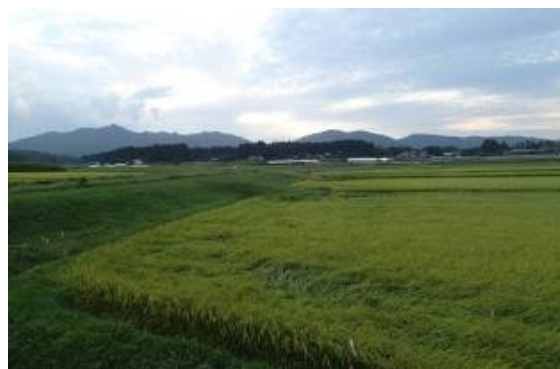
田んぼの向こうに亙理地壘山地・七峰（ななうね）