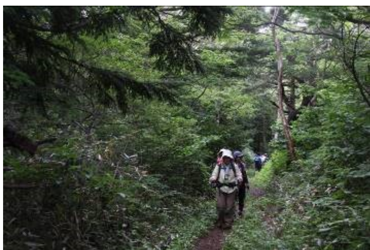
自然林の清涼な空気を満喫しました

ランの様に下を向いて釣鐘の形で数輪まとまっている。「ん〜」と思わず唸ってしまった。「ツツジでこんな種類があるんだ。」と驚いた。未だ、つぼみも付いていて本当に見頃で、可愛いし、美しい。中々出会えないらしく「今日は、大変幸運」との事。