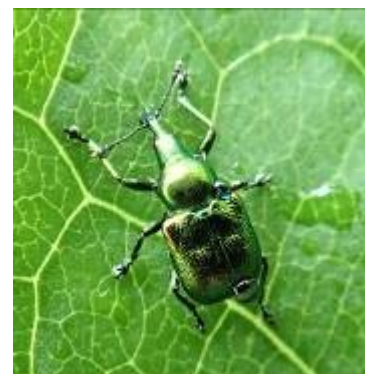
ドロハマキチョッキリ

甲虫の1種。日本産テントウムシ科の最大種。幼虫はクルマシロシなどの幼虫を食べ、成虫で樹皮下や岩の間で越冬。沢沿いに多く生息する。赤い警戒液を分泌する。卵は楕円形で美しいオレンジ色。