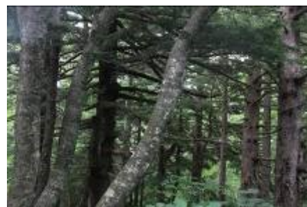
キタゴヨウマツとコメツガの混成林