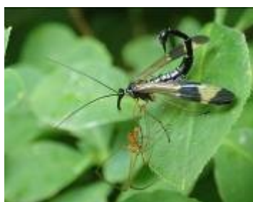
ヤマトシリアゲムシ

ネズミやカエルや小鳥などの動物の死体に集まり、それを餌とする甲虫。名前の由来は、死体があると出てくるため、「死出虫」と名づけられたことによる。森の葬儀屋。死体を地中に埋めて肉団子に加工し、これを口移して幼虫に与える習性を持ち、親が子の世話をする「亜社会性昆虫」として知られる。ダニが着いているので接触注意。