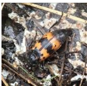
ヨツボシモンシデムシ

甲虫チョッキリゾウムシの仲間では体色が美しい。中部以西のものは、上翅に金赤色斑があり、中部以東のものは赤い紋がなく、緑色型と呼ばれる。イタドリ、ヤマブドウ、サルナシ、マンサク、コナラ、カエデ、ヤナギなどの葉を巻く。