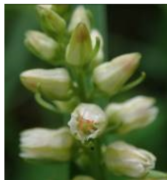
ネバリノギランの花冠は半透明