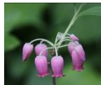
ウラジロヨウラク