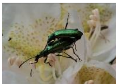
ルリハナカミキリ

甲虫。花や葉上で待ち伏せし小昆虫を捕獲する肉食性。4月ごろ幼虫はコケや石の下で蛹になる。名前は平清盛の法名の浄海坊に由来する。分泌液は有毒。