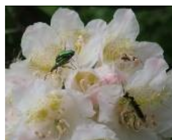
シャクナゲに集う昆虫達