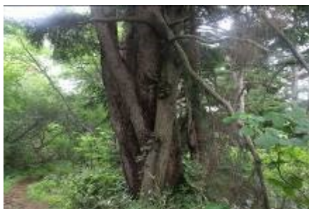
キタゴヨウマツとコメツガの抱擁